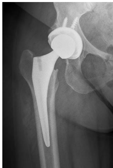
En la imagen de radiografía a la izquierda se ve el colapso de la cabeza femoral lisa (ver flecha). Ello se puede tratar con un reemplazo total de cadera (derecha).