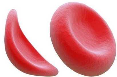
Figuras de un glóbulo rojo fino, falciforme y un glóbulo rojo redondo y normal.

(Cabeza femoral), o puede desplomarse, lo que puede causar dolor articular severo y un desarrollo temprano de artritis. La osteonecrosis es la razón más común de reemplazo de cadera en pacientes jóvenes con anemia falciforme. Sin embargo, antes de realizar un reemplazo de cadera, se realizan tratamientos con medicamentos y terapia física para tratar de ayudar con el dolor antes de realizar una cirugía.